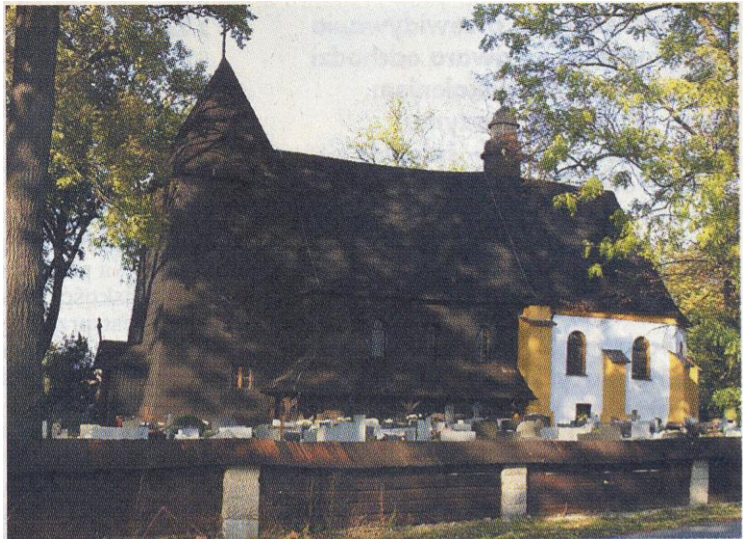
Kościół w Rachowicach, wzmiankowany już w 1376 roku